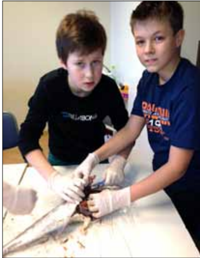
Áhugasamir nemendur að kryfja fisk.