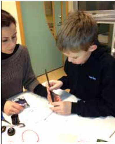
Það er alltaf gaman að fá nemendur á öllum aldri í heimsókn í náttúrufræðistofuna.

Nemendur í 8. bekk fóru á kynningu hjá 4. bekk um reikistjörnurnar. Svo fóru allir 8. bekkingar í 3. og 4. bekk og kenndu þeim það sem þau voru að læra um himingeiminn. Hér er 4. ESÓ búinn að koma sér fyrir á gólfinu og tilbúinn að skoða stjörnuhimininn sem var varpað upp í loftið.