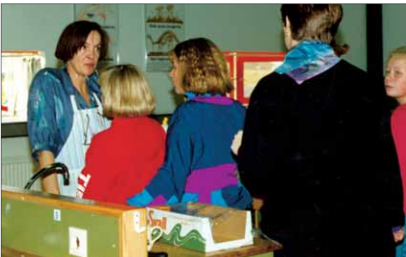
Ingibjörg er enn full af starfsorku þó hún hafi kennt í rúm 40 ár.

Það fengu ekki allir í Gagnfræðaskólanum kennslu í matreiðslu allan veturinn, eingöngu þeir sem fóru í verknám. Þeir sem