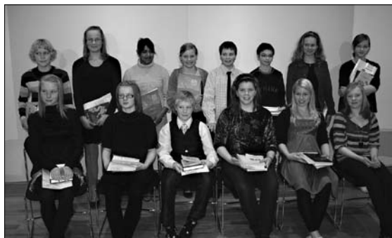
Þátttakendur í Stóru upplestrarkeppninni.

síðustu árið í sessi í menningardagskrá Vökudaga á Akranesi. Ekki færri gestir komu í skólann til að sjá árshátíð Grundaskóla. Sex sýningar voru og uppselt á þær allar. Yfirskrift árshátíðar eða þema hennar var Lífið er yndislegt . Líkt og síðustu ár tóku allir nemendur í