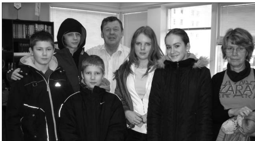
Nemendur úr móttökudeild með bæjarstjóranum.

Margra þátta er enn ógetið og ofangreind upptalning felur ekki í sér forgangsroðun af neinu tagi heldur er fyrst og fremst dæmi um þá miklu grósku sem er í skólastarfi Grundaskóla.