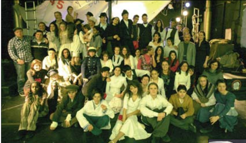
Hópurinn sem stóð að sameiginlegu sýningunni í Svíþjóð.